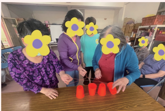
預防及延緩失能課程