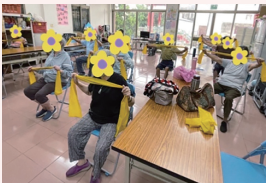
樂齡彈力球、彈力帶、毛巾操