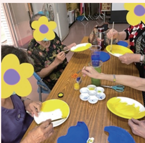
端午節創意紙盤龍舟製作