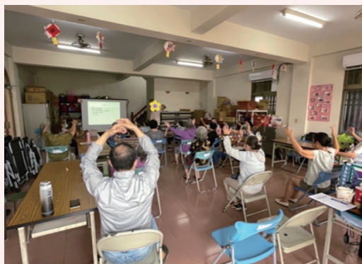
家屬教育訓練 - 物理職能治療 舒壓及伸展提升生活品質改善健康