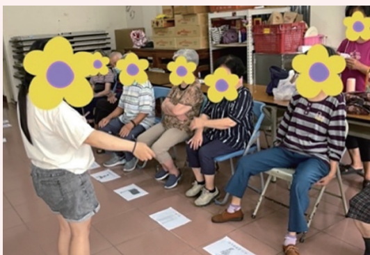
團康活動 - 健身大富翁