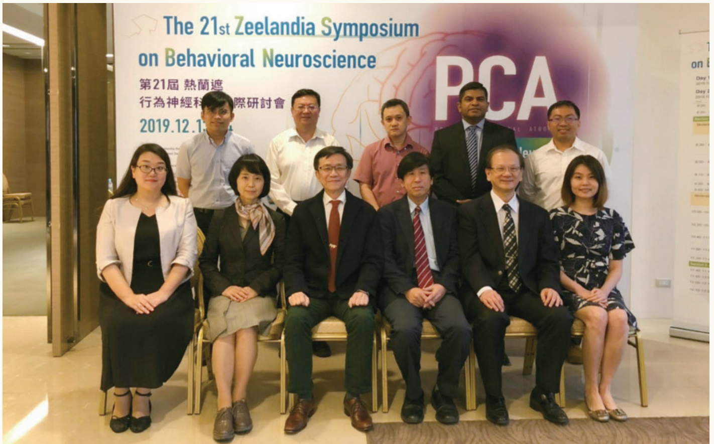
※ 圖片說明：由成大醫院失智症中心主任白明奇教授（前排左三）主持的亞洲區後大腦皮質退化症研究團隊會議，2019 年 12 月在成大校友會館召開。

醫院失智症中心暨共照中心主任白明奇教授表示，2019 年底在成功大學召開的主持人會議中，大家一致認為應該在各國加強宣導後大腦皮質退化症，提升大眾的認知，減少家屬不必要的焦慮並得到正確的治療方向。